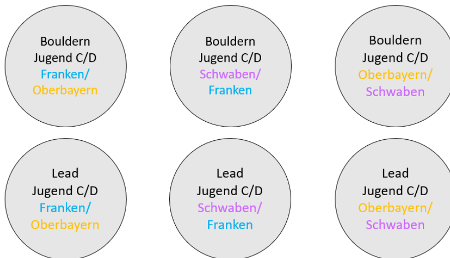
Abb. 2: Dualstartsystem

Insgesamt werden sechs regionale Kids Cups ausgetragen, drei Lead und drei Bouldern. Auf unserer Homepage findet ihr das aktuelle Kids Cup Regelwerk als Download. Zusätzlich gibt es zwei Bayerische Speed Cups. Die Ausschreibungen der jeweiligen Kids Cups richten sich ausschließlich an Athletinnen und Athleten in der Region. Die Athletinnen und Athleten haben die Möglichkeit, bei vier Kids Cups teilzunehmen (2x Bouldern, 2x Lead). Es wird nach dem Dualstartsystem geklettert, d.h. jede der drei Regionen in Bayern (Oberbayern, Franken, Schwaben) tritt je einmal gegen die anderen an.